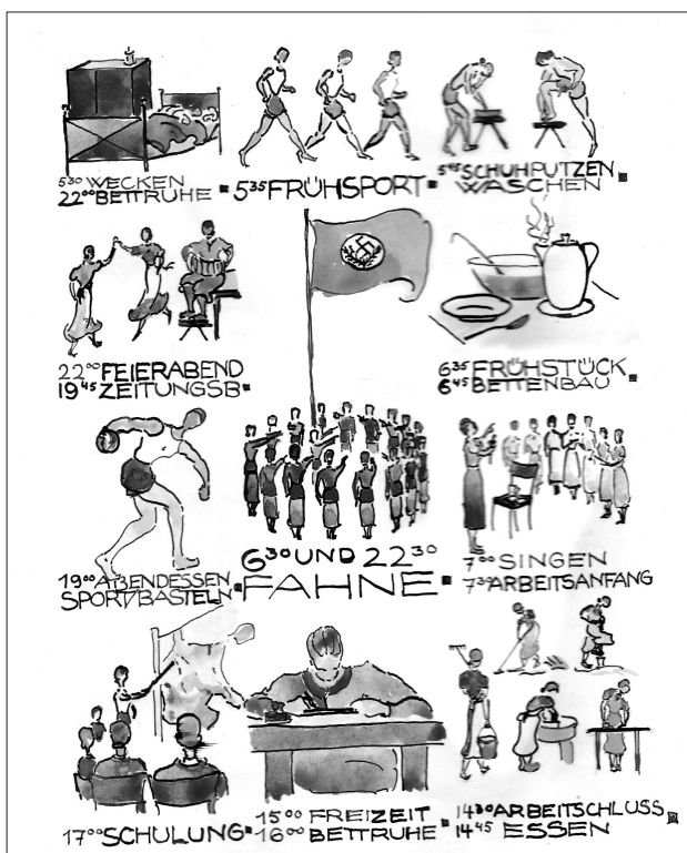
Horario de las actividades diarias, Theodora ALGERMISEN: «RAD», p. 14.

separar sus acciones de su contexto geo y biopolítico para encajar con la audiencia contemporánea. Sin embargo, en el momento, se tomaba esas responsabilidades bastante en serio. Un ejemplo, durante la última noche en el campamento se celebró un esmerado acto con la bandera en el que la instructora compartió citas inspiradoras con el grupo que acababa su servicio para animarlas a la participación voluntaria en la Volksgemeinschaft 82 y Theodora