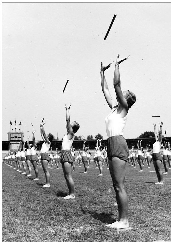
Jóvenes haciendo gimnasia, Breslau, julio de 1938, Theodora ALGERMISSEN: «RAD», p. 159.

dotas, Theodora hace uso del humor para distanciarse de las obvias implicaciones políticas de no encajar en el prototipo de cuerpo ideal para una mujer aria en la Alemania nazi, actuando como si este fuese otro giro divertido en sus aventuras. Aun así, en su autobiografía, Theodora escribió que se había puesto «terriblemente triste» cuando parecía que iban a ser excluidas porque una de sus compañeras contrajo difteria, y, de nuevo, cuando el propio Führer