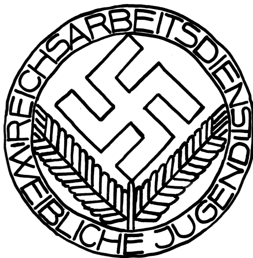
Frontispicio, Theodora ALGERMISSEN: «RAD», p. 1.