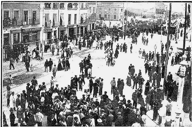
Aspecto de la Glorieta de los Cuatro Caminos durante los disturbios ocurridos en la tarde del domingo 9 del actual