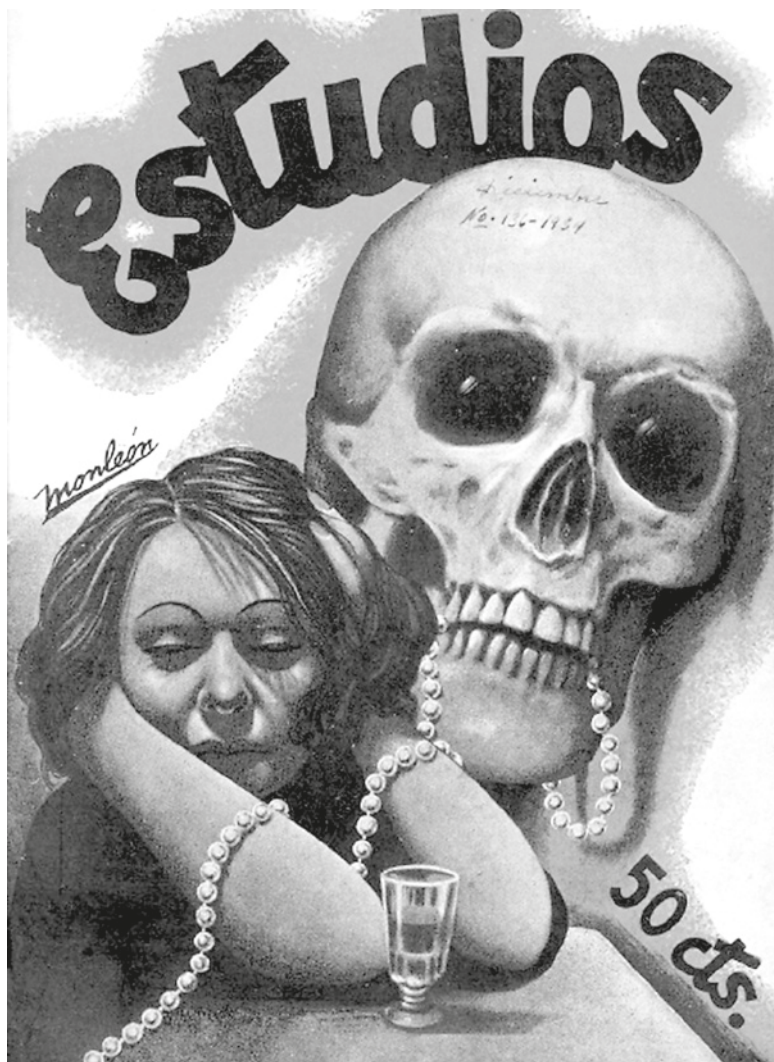
Fuente: Estudios, 136 (1934).

Portada de la revista Estudios en la que se equipara la prostitución con el vicio sexual y la muerte